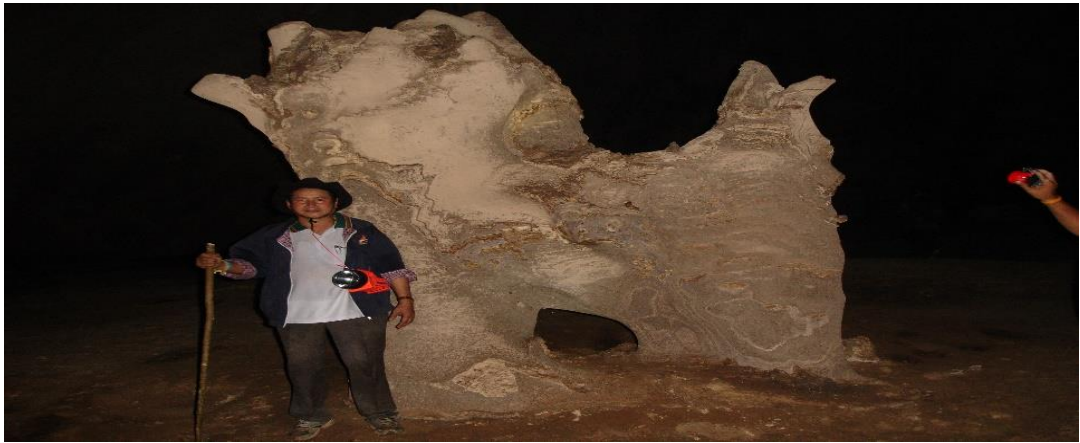
๒. ซากหอยดึกดำบรรพ์ ตั้งอยู่หมู่ที่ ๔ ตำบลหน้าเขา อำเภอเขาพนม จังหวัดกระบี่